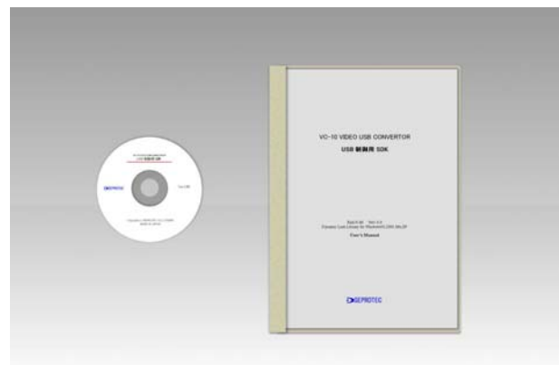
(写真) USB 制御用 SDK VC-10_SDK

USB 制御用 DSK VC-10_SDK (オプション)で VC-10 画像転送制御アプリケーションが簡単に作ることができます。