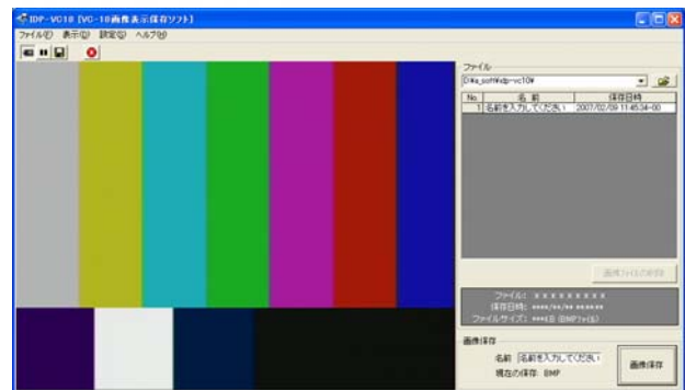
(写真) 画像表示保存ソフト IDP-VC-10

VC-10の映像は画像表示保存ソフト IDP-VC10で観察することができます。観察している画像は、保存することができます。保存した画像を見ることもできます。