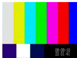
● 表示I カレンダーと時刻を2行で表示します。

表示タイプは2種類(表示I・表示II)が設定できます。 表示位置は、画面上のお好みの位置に設定できます。