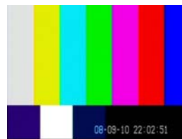
● 表示II カレンダーと時刻を1行で表示します。